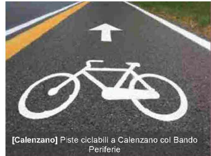
[Calenzano] Piste ciclabili a Calenzano col Bando Periferie